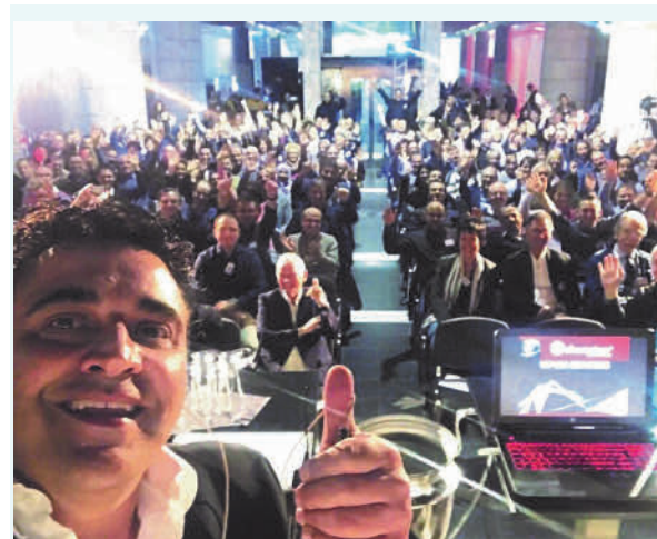
Im CHAMPIONS FUTURE CENTER: Fortbildung, die alle motiviert

Tel. 06734 914080, Fax 06734 1053, info@champions-implants.com, www.championsimplants.com