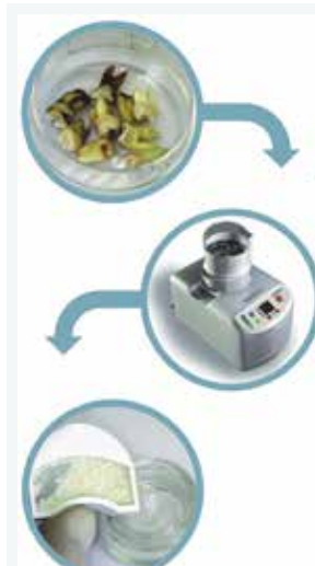
Das ist der Clou: Patienteneigene Zähne (Bild oben) werden im Smart Grinder aufbereitet (Bild Mitte) und als Knochenaugmentat weiterverwendet (Bild unten)

Champions-Implants GmbH Tel. 06734 914080, Fax 06734 1053, info@champions-implants.com, www.championsimplants.com/ SmartGrinder oder auf der IDS: Halle 4.1 / Stand B 71.etc.