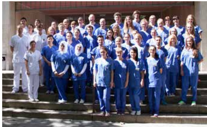
Das fertige Semester in der Prothetik 2017