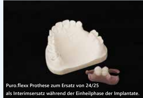
Puro.flex Prothese zum Ersatz von 24/25 als Interimsersatz während der Einheilphase der Implantate.

Alle Infos: RAINER DENTAL e.K., Regensburger Str. 24, 84048 Mainburg, Tel. 08751 77868-0, Fax 08751 77868-50, E-Mail: info@puroflex.de, www.rainerdental.de